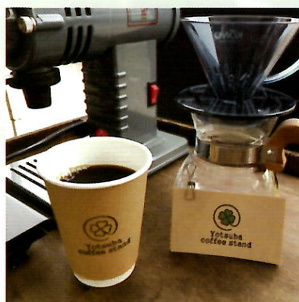
Yotsuba coffee stand